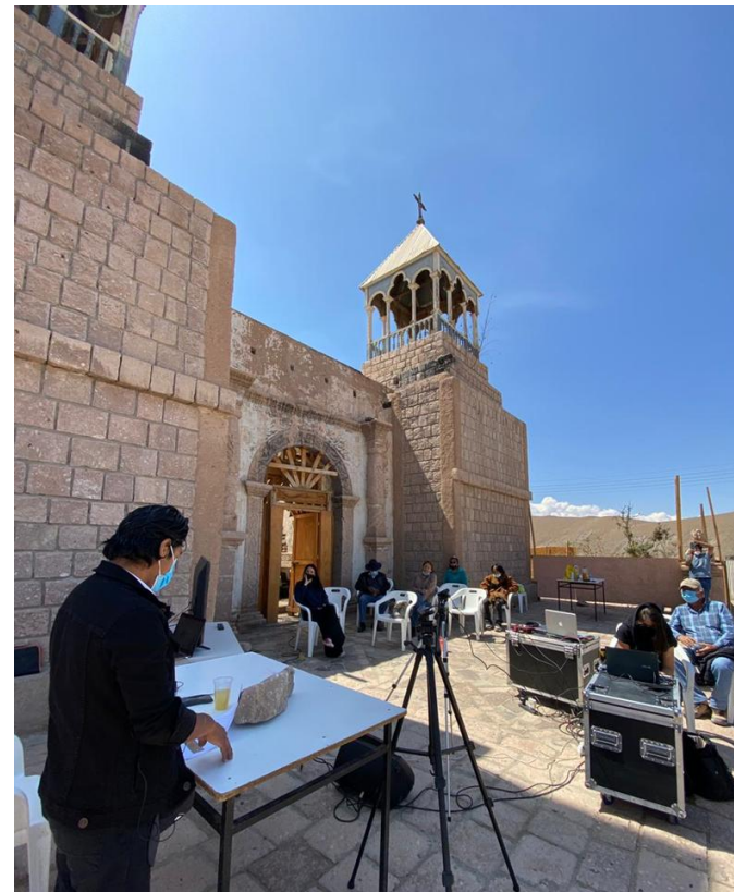
Fotografía set de transmisión Taller 04